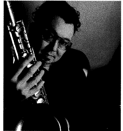
田中邦和 Kunikazu Tanaka / Tenor Saxophonist

1964年7月16日、大阪生まれ。大阪音楽大学作曲科卒。’91年よりニューヨークを拠点に活動。’97年には初リーダーアルバム「スピークアップ」を発表。在米中、ドンフリードマン、ハンク・ジョーンズなどの数々のグループでのレコーディングやライブハウスやヨーロッパツアーでの演奏など国際的に活動。2004年には活動の拠点を日本に移す。2014年には5年ぶりの7枚目のアルバム「Good Time」2017年には8枚目のアルバム「Good Time Again」をリリース。2007年度から3年連続スイングジャーナルの人気投票で1位など常に上位にランクされる。2015年まで大野雄二&ルパンティック5のメンバーとして活動。現在、自己のグループ他、塩谷哲トリオ、大西順子、渡辺香津美、佐山雅弘VINTAGEのレギュラーメンバーとして活動の他、数々のセッションに参加し日本のみならず海外でも精力的に活動。