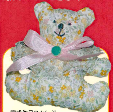
完成作品のイメージ 制作所要時間 2時間半～3時間