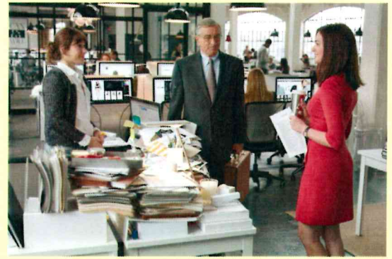
(c) 2015 Warner Bros. Entertainment Inc. and RatPac-Dune Entertainment LLC. All Rights Reserved.