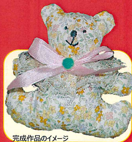
完成作品のイメージ