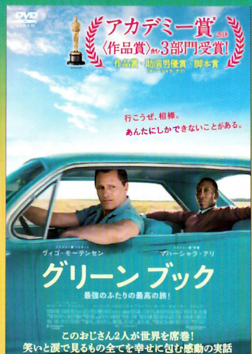
(C)2018 UNIVERSAL STUDIOS AND STORYTELLER DISTRIBUTION CO., LLC. All Rights Reserved.