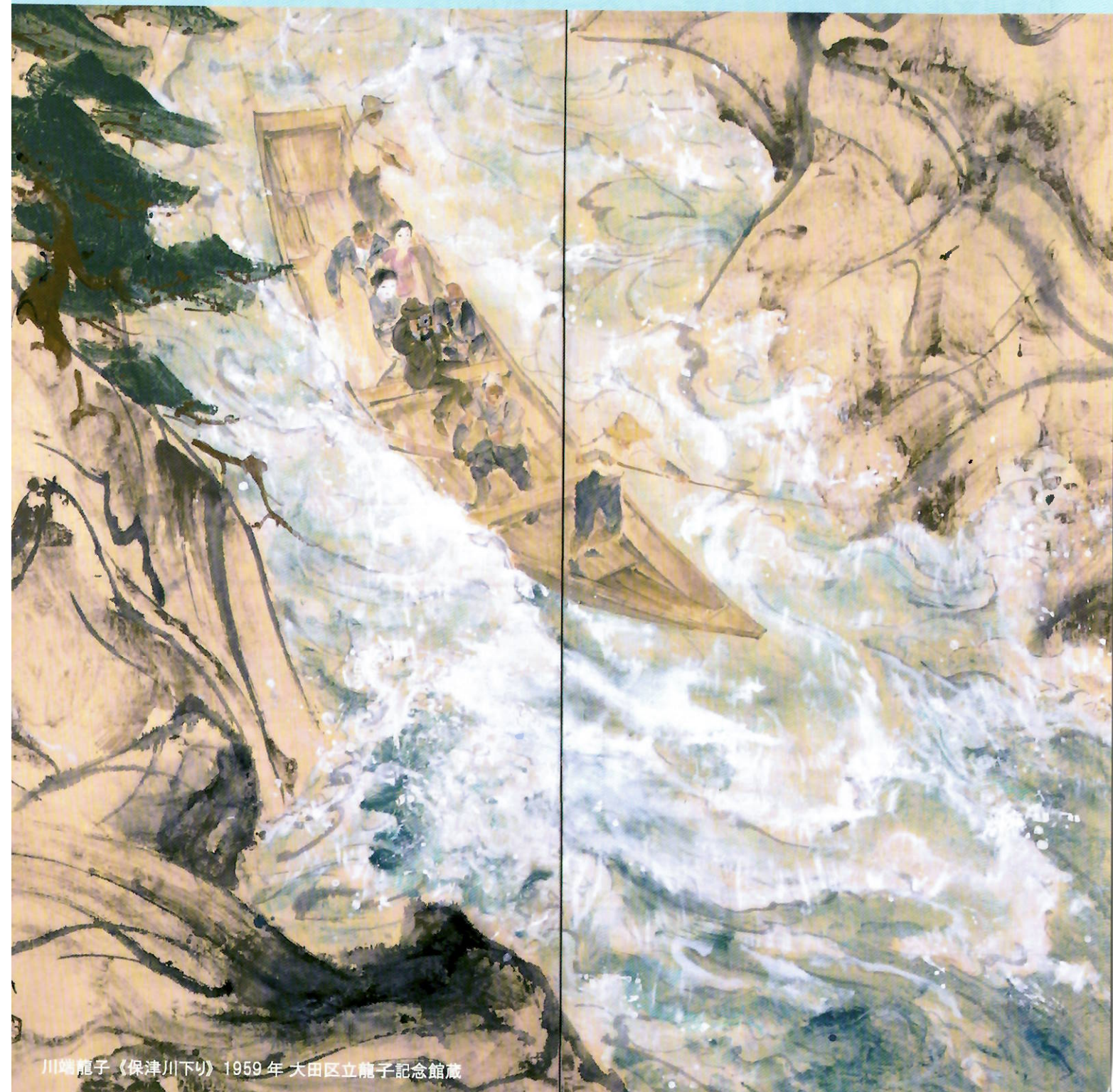
川端龍子《保津川下り》1959年 大田区立龍子記念館蔵