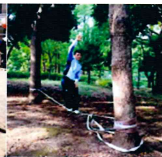
スラックラインの様子

運営協議会では、文化祭に遊びに来てくれた子どもたちに広場で思いっきり楽しんでもらう企画を考えました。パターゴルフ、スラックライン、紙玉パチンコ（的あて）、シャボン玉などを実施。広場でもホール企画から一部のグループが舞台出演しますので、家族全員、広場に集合！（雨天の場合は中止となります）