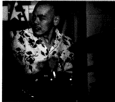
江藤良人 (ドラムス)

日本を代表するジャズドラマー江藤良人率いる“カラテチョップス”豪華メンバーでお送りする陽気で楽しいスペシャルコンサート