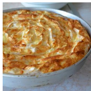
パニッツアイメージ