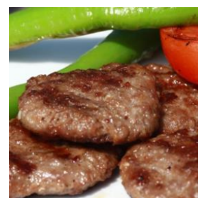
キョフテイメージ