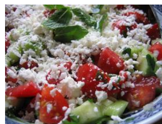
ショブスカサラダイメージ